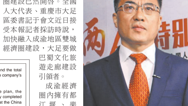
全國人大代表、重慶市大足區委書記于會文

【香港商報訊】記者童文武、蔣曦報道：今年，成渝地區雙城經濟圈建設已然開啓。全國人大代表、重慶市大足區委書記于會文近日接受本報記者採訪時說，加快融入成渝地區雙城經濟圈建設，大足要做巴蜀文化旅遊走廊建設引領者。