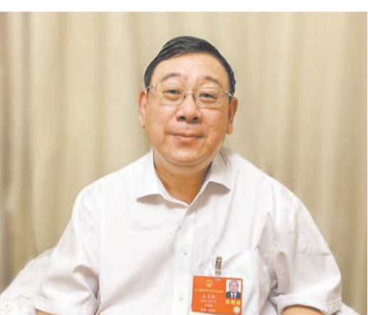
全國人大代表、國網湖南省電力有限公司董事長孟慶強

【香港商報訊】記者張思靜報道：新冠肺炎疫情發生之後，國家電網湖南省電力有限公司為疫情疫情防控和復工復產提供了一系列服務和保障。全國人大