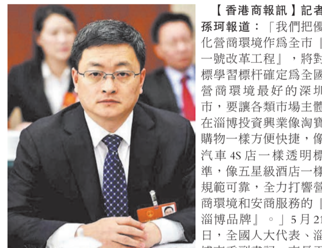
全國人大代表、淄博市委副書記、市長于海田

【香港商報訊】記者孫珂報道：「我們把優化營商環境作為全市「一號改革工程」，將對標學習標榜確定為全國營商環境最好的深圳市，要讓各類市場主體在淄博投資興業像淘寶購物一樣方便快捷，像汽車4S店一樣透明標準，像五星級酒店一樣規範可靠，全力打響營商環境和安商服務的「淄博品牌」。」5月21日，全國人大代表、淄博市委副書記、市長于海田向記者如此說道。