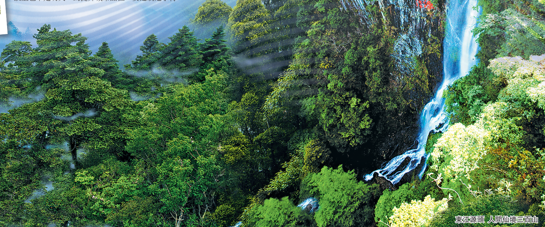
東江源頭 人間仙境三百山

文旅市場的復蘇，進一步賦能安遠全域旅遊的高質量發展。今年，安遠縣將做好舉辦2020年東江源三百山鄉村馬拉松賽、開通三百山客運索道、建設三百山運動休閒生態公園等旅遊產業工作十件大事。目前客家博物館於5月份開業，桃園山居（溫泉二期）已全面啓動。