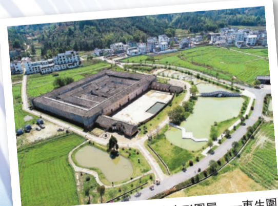
中國最大的客家方形圍屋——東生圍

安遠以全域旅遊為引領，以「兩天半」旅遊圈為核心抓手，將旅遊特色元素融入經濟社會建設的各