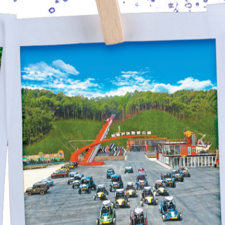
「體育+旅遊」安遠縣浪馳戶外越野公園