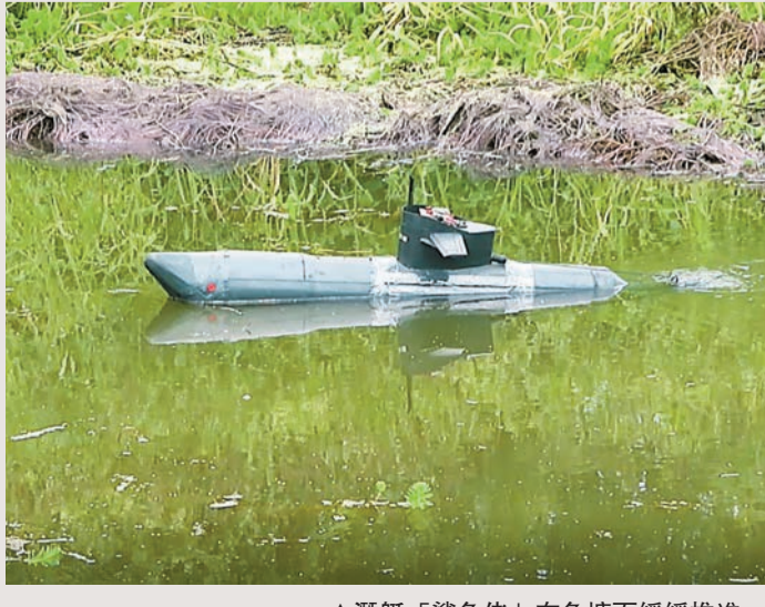
▲潛艇「鯊魚佬」在魚塘面緩緩推進。