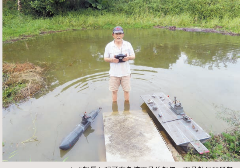
▲「艦長」明哥在魚塘不是放船仔，而是航母和潛艇。