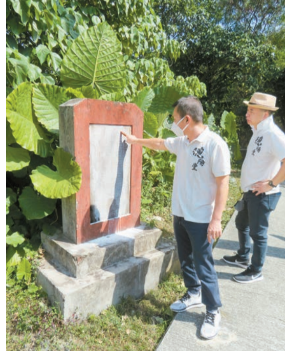
▲石陂頭碑誌記載政府 50 年代在梧桐河做梯級形石壩防洪的故事。

水多濕氣重，石頭顏色沒那麼鮮艷，當到冬季乾爽日子，呈現如七彩顏色，所以叫七彩古井。廖相信今次維修可印證歷史，「古井是沒有井頸，說明附近沒有小孩，即不會是一般村民用。另外，有村民說 60 年代古井覆蓋了四塊大麻石，未蓋之前，見到石頭有字，若揭走麻石，見到『中英公司、KCR 或羅湖公司』這些字，便可確定了。」