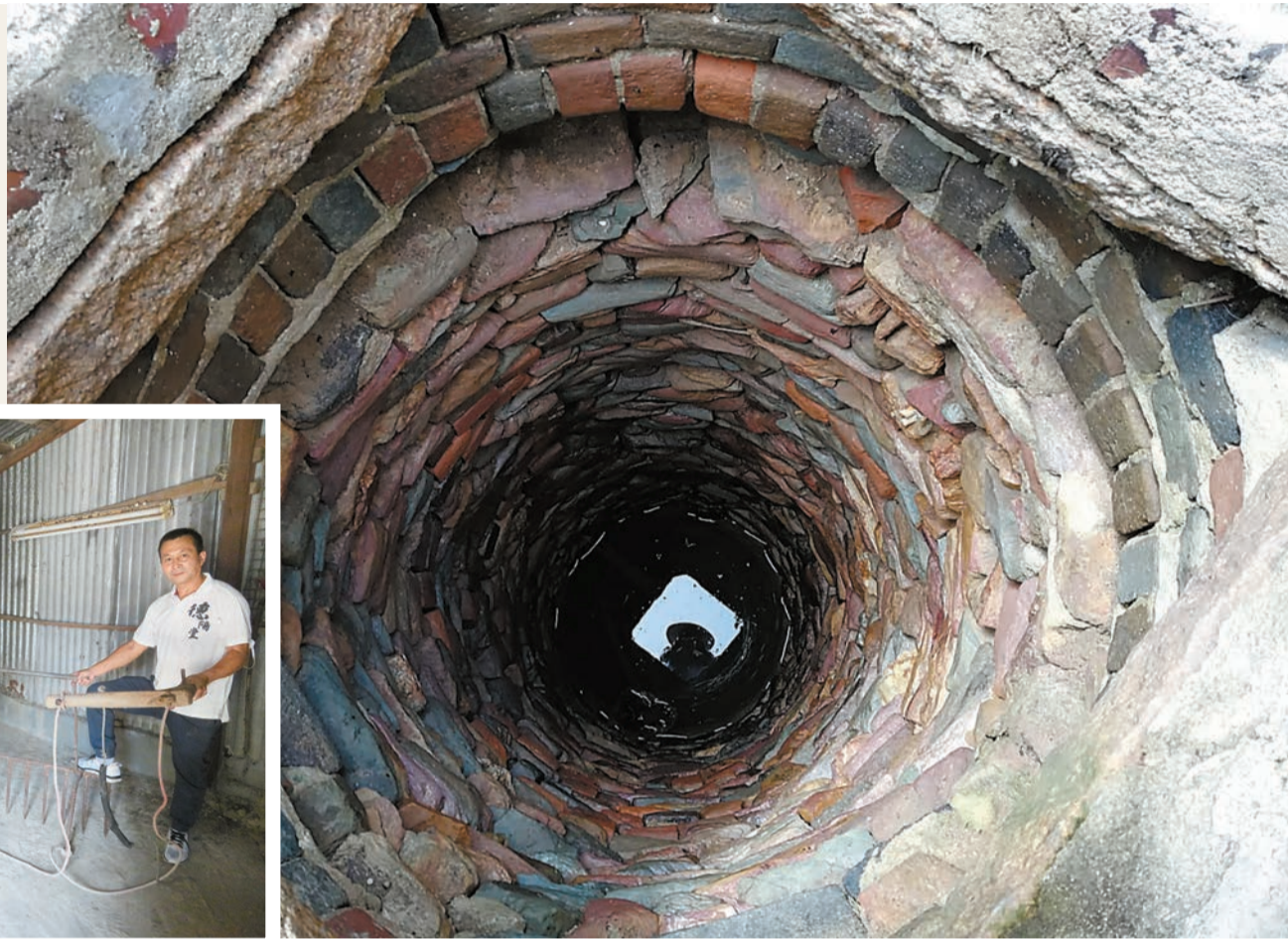
▲古井由礫石堆砌而成，乾爽日子會出現七彩顏色。