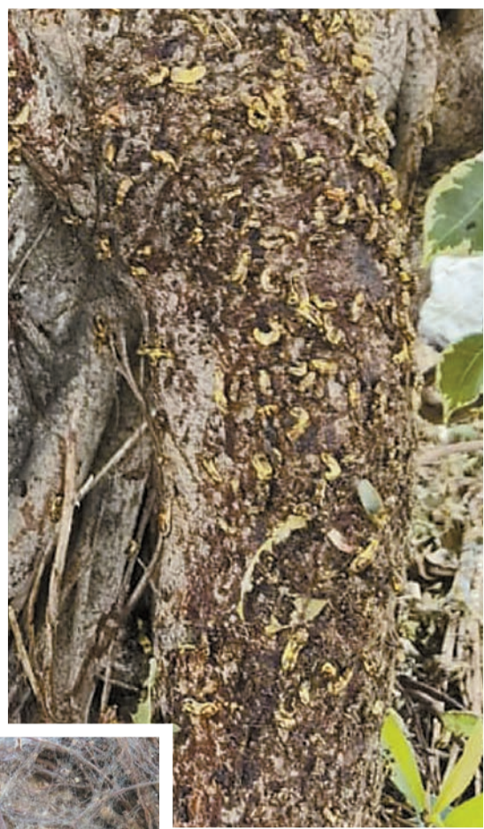
▲坪洋村民居旁榕樹成蟲窩。▲梧桐河畔榕樹的幼蟲吃飽待成蛹。

新界村民對今次蟲害十分緊張，事件令他們憶起數十年前，馬尾松曾因感染松材線蟲而大量死亡，恐怕榕樹會成翻版，期望政府要好好處理。新界鄉議局及環保協進會亦已於5月底分別去信樹木管理辦事處表達憂慮及關注。