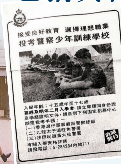
▲1970年代，當年的香港警務處在報章上刊登警察少年訓練學校的招募廣告。

警察少年訓練學校其後再予以擴充，於1977年在「芬園營校區」附近的另一個叫「天祥營」(Dodwells Ridge Camp)的舊英軍軍營，改作學校的第二個校區。