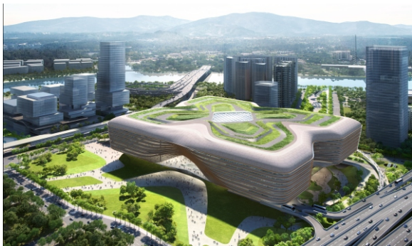
▲ 皇岗口岸是国内最大、唯一24小时通关的陆路口岸，是联系河套深港科技创新合作区深港双方园区的重要节点，也是串联广深港科技创新走廊的重要枢纽。