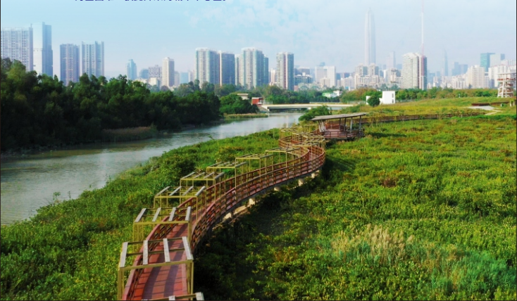
▼ 深圳市福田区山青水绿环境优美，宜居宜业宜游。成功创建“国家生态文明建设示范区”，为全国唯一获此殊荣的城市中心区。