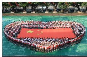
▲ 深圳市福田区创新推出学位供给“双十工程”，新增学位约2万个，促进区域基础教育规模、质量和水平的整体提升，广东省教育质量监督监测名列前茅。