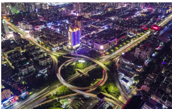
▲ 宝安区创业立交桥夜景