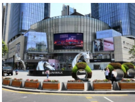
▲ 宝安区大型商业综合体--壹方城购物中心