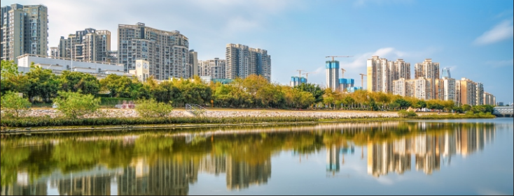
▼ 宝安区新安街道双界河