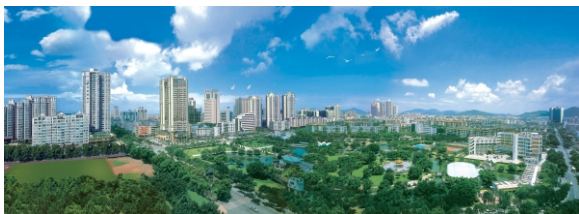
▲ 新安街道新安公园

新安街道是宝安区委区政府所在地，自深圳建市以来一直是宝安的政治经济文化中心，也是宝安城市化进程最早的区域。其地理位置优越，处于深港经济圈的核心区域，是穗深港发展轴黄金走廊的重要节点，是联系粤港的桥梁和辐射内地的重要窗口，具有得天独厚的区位优势。与前海蛇口自贸片区一桥相连，与留仙洞战略性新兴产业总部基地、西丽国际科教城、深圳湾超级总部互为支撑。此外，新安辖区内交通四通八达，机场、大铲湾近在咫尺，广深高速、沿江高速和107国道纵贯南北，已建、待建8条地铁线路站点密布，交织出海陆空铁“四位”一体的大交通格局。