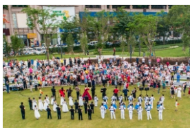
▲ 宝安四季公园“周末音乐会---手风琴专场演出”