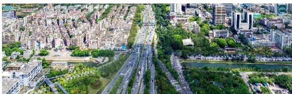
▲ 宝安区107国道 (2020年摄影)