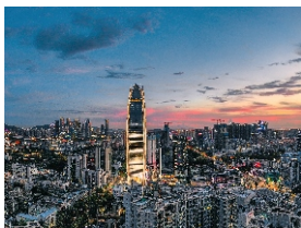
▲ 恒明珠国际金融中心（宝安第一高楼）