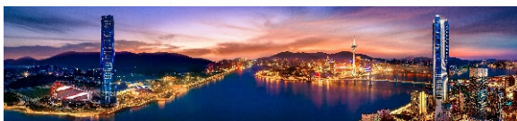
▲ 十字门中央商务区夜景全貌