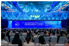
▲ 21世纪海上丝绸之路中国（广东）国际传播论坛