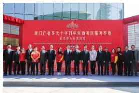
▲ 澳门产业多元十字门中央商务区服务基地