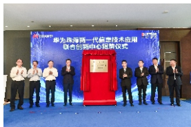
▲ 珠海新一代信息技术应用联合创新中心