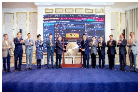
▲ 澳门首单公募公司债券“莲花债”