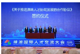
▲ 珠澳国际人才交流大会