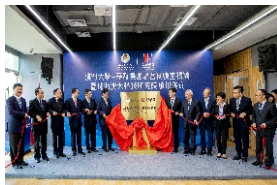
▲ 澳大·华发联合实验室