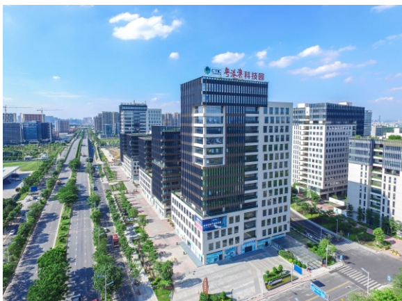
▲ 三山新城粤港澳科技园