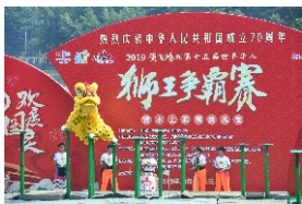
▲ 西樵山举行狮王争霸热烈庆祝中华人民共和国成立70周年