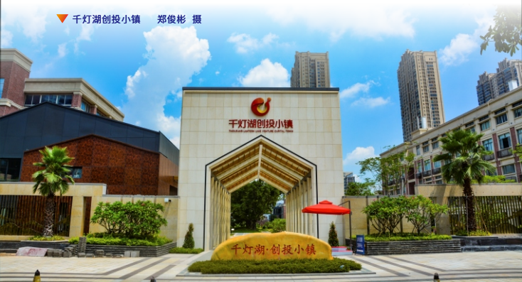
▼ 千灯湖创投小镇