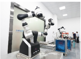
▲ 广东首批四大省级实验室之一的佛山季华实验室的机器人设备