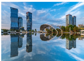
▲ 广东金融高新区