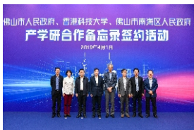
▲ 香港科技大学与佛山市、南海区合作备忘录签约仪式