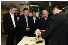
▲ 中央人民政府驻香港特别行政区联络办公室主任王志民（右二）率考察团一行考察调研粤港澳科技展示交流中心

南海区的区域综合实力连续多年位居全国中小城市百强区第二名，2020年，南海实现地区生产总值3177.5亿元，地方一般公共预算收入248亿元，勇夺2020全国高质量发展百强区第二名，并三度荣膺中国最具幸福感城市。