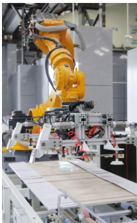
▲ 蒙娜丽莎瓷砖自动化生产线