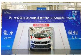
▲ 一汽-大众华南基地举行第150万辆整车下线仪式。