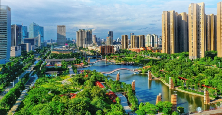
▼ 魅力南海城市-南海宣