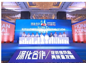
▲ 佛山南海与香港·粤港澳合作高端服务示范区建设工程管理服务创新论坛与对接会举行启动仪式。

近年以来，南海坚持以习近平新时代中国特色社会主义思想为指导，全面深化改革开放，成为全国33个土地改革试点地区之一、以及全国乡村治理体系建设首批试点区。2019年，南海被广东省委深改委赋予改革重任，建设广东省唯一的城乡融合发展改革创新实验区，为广东城乡高质量融合发展探路。