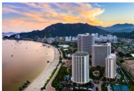
▲惠州市惠东县巽寮湾

《惠州市推动工业园区项目快速落地实施方案》日前印发，这是继今年5月出台的《惠州市实施工业园区提质增效行动方案》后，为推进惠州园区工业项目快速落地的重要配套文件，将进一步完善优化惠州营商环境工作体制机制，促进“3+7”工业园区内工业项目快速落地，推动工业园区高质量发展。