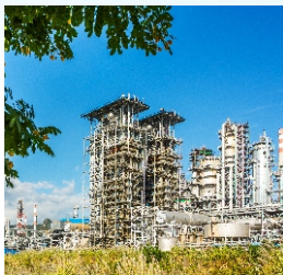
▲惠州大亚湾石化区一角

发挥惠州在大湾区中连接粤东、闽赣门户枢纽作用和空间广阔优势，畅通内地与大湾区之间经济要素双向流通，为其他地方企业到大湾区发展提供空间。发挥惠州滨海区位和对外贸易优势，加强与“一带一路”沿线国家以及RCEP成员国经济贸易联系，深化经贸合作，打造大湾区高端农副产品、石油等大宗货物以及工业制成品贸易集散地。