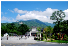
▲惠州市罗浮山