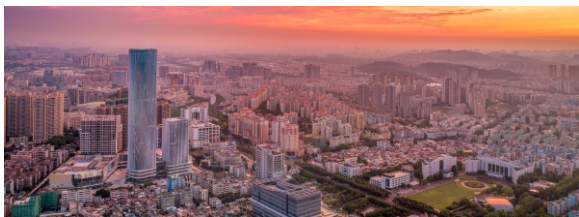
▲ 中山城区