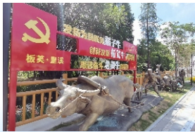
▲ “广东小岗村”中山板芙镇里溪村

四季流转，岁月绵长；美美与共，乐享和谐。这里是博爱之城。秉持中山先生精神，新时期中山人乐善好施、守望相助，34年慈善万人行风雨兼程，筹集善款超过17亿元人民币，用坚定步履丈量出小城大爱。这里是文明之城。志愿精神融入中山市民血脉，全市每六人中就有一名志愿者。中山连续六次荣膺全国文明城市称号，四次捧回全国社会治安综合治理最高奖项“长安杯”，是中国最具安全感城市之一。