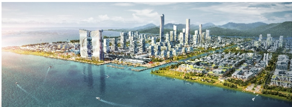
▲ 翠亨新区 未来之门(规划图)