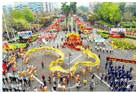
▲ 慈善万人行