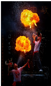
▲ 国家级非物质文化遗产长洲醉龙

中国民主革命的伟大先驱孙中山先生诞生于此，并从此走向世界。改良主义思想家郑观应，中共早期领导人杨殷，中国革命空军之父杨仙逸，广东音乐宗师吕文成，中国近代“四大百货”创始人马应彪、郭乐、蔡昌、李敏周等大批乡贤俊彦在近现代历史舞台大放异彩。著名书画家黄苗子、漫画家方成、作曲家李海鹰、亚洲短跑名将苏炳添等众多当代名人熠熠生辉。