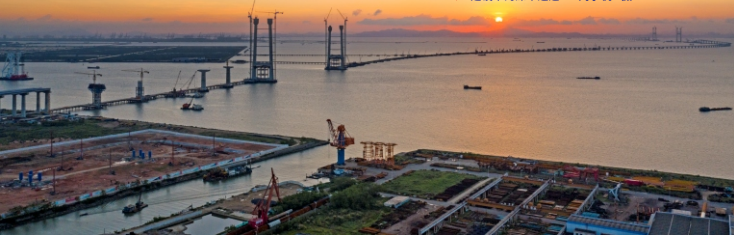
▼ 建设中的深中通道