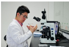
▲ 康方生物 余兆宇 摄

改革开放四十余载，中山经济发展不断换挡提速，二三产业并驾齐驱，建成电子信息、白色家电、装备制造等3个千亿级产业集群，18个产业鲜明的特色镇，拥有38个国家级产业基地，高新技术企业超过2500家，光子科学中心和先进低温研究院等重大科技基础设施加快布局，人工智能、大数据产业在这里正获得广阔空间。