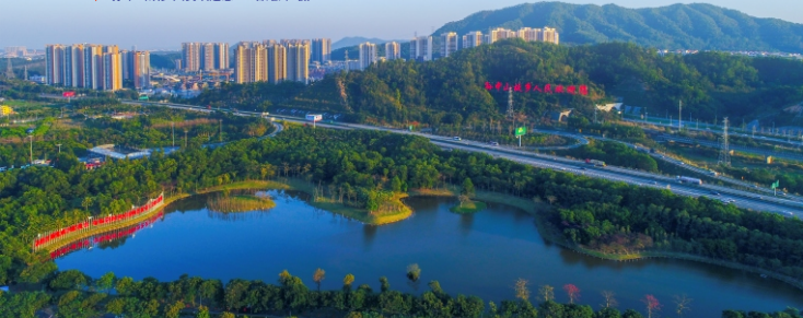
▼ 孙中山故乡人民欢迎您