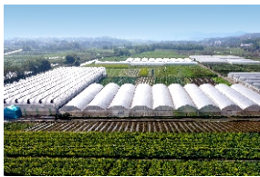
曲江区现代农业种植基地