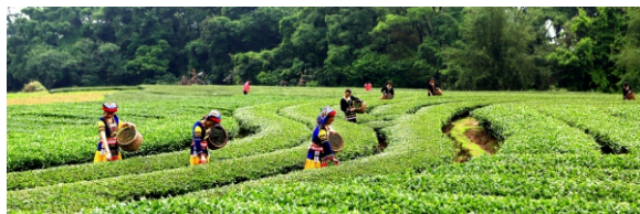
曲江生态优良，资源丰富，是韶关重要产茶区，茶叶品质优良，产量较高。图为曲江罗坑瑶家女喜采春茶。