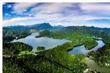
曲江区枫湾镇享有小桂林称号，附近的笔架山山岗起伏，风景迷人，被誉为“大地调色板”。图为枫湾笔架山。