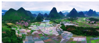
曲江区枫湾镇享有小桂林称号，附近的笔架山山岗起伏，风景迷人，被誉为“大地调色板”。图为枫湾笔架山。

曲江拥有丰富的自然资源和生态资源，在注重生态保护的同时推进资源资产价值化，积极探索协同推进生态环境保护和经济发展，把生态优先理念贯穿到经济社会发展全过程，积极参与粤北生态特别保护区建设，让曲江的天更蓝、山更绿、水更清。