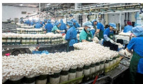
曲江区拥有广东省首个定位为食用菌类型的农业产业园，目前引进了食用菌行业农业企业11家。图为工人正在包装准备出口的食品菌