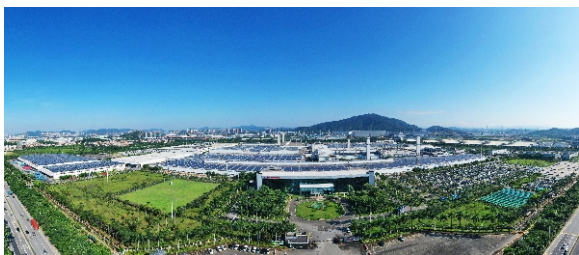
▲ 广本增城工厂实现整车产能53万辆，2020年产值739亿元，日立马达、中汽研华南基地建成投产，集聚38家规上零部件企业，形成汽车全产业链，汽车及新能源汽车产业集群不断做强做大。