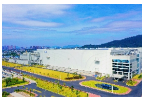
▲ 超视堺8K项目产能逐步爬坡，2020年实现工业产值28.81亿元（含康宁玻璃），预计2021年实现工业产值140亿元（含康宁玻璃）。