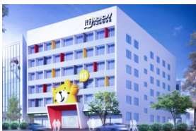
▲ 增城侨梦苑·Hi Monday平衡办公社区 新塘园区分园区