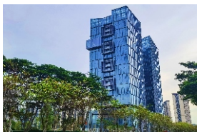
▲ 增城侨梦苑·宝盛国际创新中心分园区