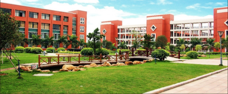
▼ 增城侨梦苑·华商众创孵化器分园区