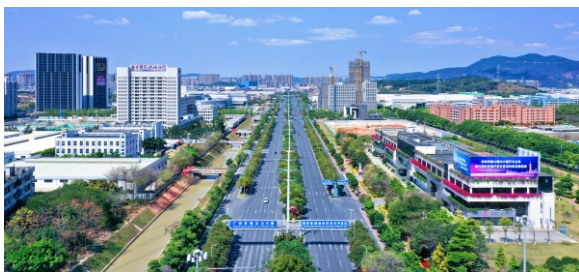
▲ 国家级增城经济技术开发区

增城经济技术开发区创建于1988年，2010年3月升级为国家级经济技术开发区，目前“一区多园”建设管理面积99平方公里，其中核心区面积25.49平方公里。增城开发区实施制造业强区战略，以龙头企业带动上下游产业链集聚，汽车及新能源汽车、新一代信息技术、金融科技等产业集群日益发展，现代化产业体系加快构建。