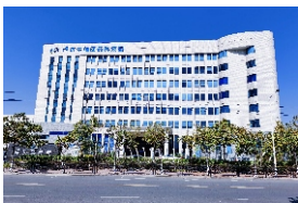
▲ 增城侨梦苑·博济生物医药科技园分园区