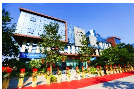
▲ 增城侨梦苑·迅镭产业孵化器分园区