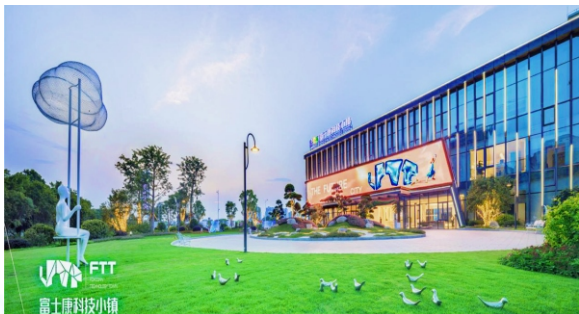
▲ 增城侨梦苑·富士康科创园分园区