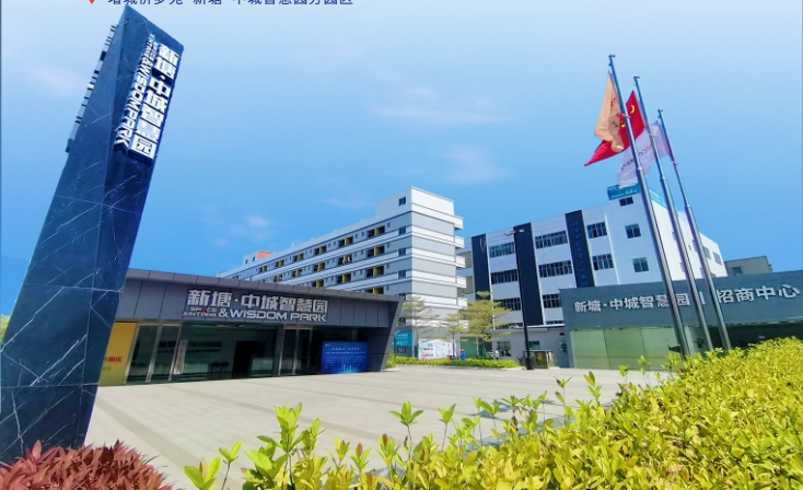
▼ 增城侨梦苑·新塘·中城智慧园分园区