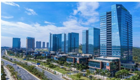
▲ 增城侨梦苑·低碳总部园分园区

广州增城侨梦苑成立5年以来，始终坚持新发展理念，全面实现加速发展，收获了阶段性成果。自2019年以来，增城侨梦苑在开发区侨梦苑（核心区）的基础上，认定了低碳总部园、迅镭产业孵化器、增科院高新产业孵化器、1978电影小镇、前沿孵化器、富士康科创园、博济生物医药科技园、新塘·中城智慧园、华商众创孵化器、宝盛国际创新中心、Hi Monday平衡办公社区新塘园区等11个分园区，形成“1+11”格局，总面积超24万m 2 ，是拓展前面积的11倍，可容纳创新创业项目约700个，形成了良好的发展态势。