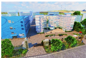
▲ 增城侨梦苑·增科院高新产业孵化器分园区