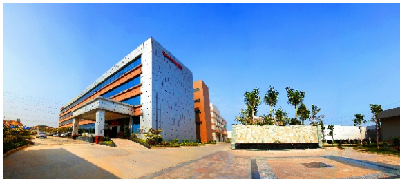
▲ 增城侨梦苑·前沿孵化器分园区

增城区按照“拓园区、拓对象、提效率、造环境”的思路，充分发挥区位、政策、服务优势，实施侨梦苑“一苑多区”模式，制定侨梦苑分园区准入门槛和退出机制，拓展侨梦苑范围；突破“华侨华人”单一服务对象，积极招揽全球侨商、港澳台、海归、海外人才落户；构建“1+N”多元招商体系，建立政府与园区积极联动的招商机制，明确园区招商主体责任，充分发挥政府引导、资源共享、快速响应的优势，大力提升引资引技引智效率；完善交通、医疗、教育和商住等各项配套设施，制定国内领先的政策体系，大力提升园区服务质量，营造良好创新创业环境，着力把增城侨梦苑打造成为粤港澳大湾区创新产业集聚区。