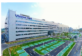
▲ 维信诺模组生产线项目建成试产，预计2021年实现工业产值20亿元，新一代信息技术产业集群加快形成。

▼ 平安（增城）科技硅谷项目一期加快建设，江铜供应链园区入驻企业145家，2020年实现销售额1041.16亿元，推动金融科技产业集群发展。