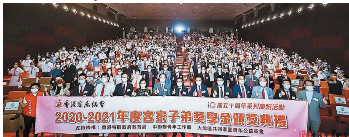
嘉賓、首長、得獎者及出席者大合照。