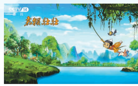
易大集團擁有國家文化出口重點項目《白頭葉猴》嘉猴壯壯》等一系列全知識產權資產。

2021年，中國—東盟博覽會連續舉辦18屆，中國與東盟雙邊貿易呈現出超預期的發展態勢。2020年，東盟首次以4.74萬億美元的進出口額，成為中國第一大貿易夥伴。但作為面向東盟的國際大通道的廣西，2020年，廣西與東盟進出口額達2375.7億元，僅佔全國比例約5%。開放合作核心競爭力尚待凸顯。 蔡寧 徐玉瑩