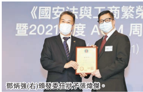
鄧炳強(右)頒發委任狀予張煒傑。

【香港商報訊】香港中小企經貿促進會日前在灣仔會展舊翼舉辦「國安法與工商繁榮」研討會，保安局局長鄧炳強應邀擔任主講嘉賓，香港中國企業家協會副總裁金萍、立法會議員謝偉俊擔任主禮嘉賓。該會同場進行了第九屆理事會的就職儀式。