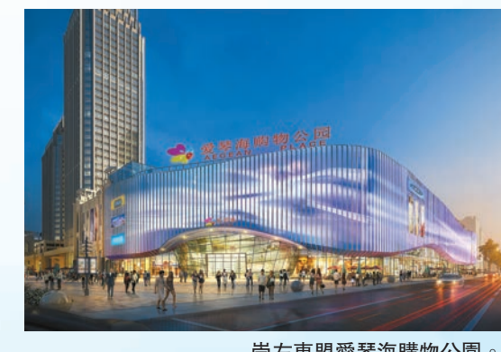
崇左東盟愛琴海購物公園。

武漢理工大學交通物流學院教授楊家其表示，後疫情時代，線上線下相結合是貿易發展的未來趨勢。當前廣西物流供應鏈還存在發展規模小、技術水平低、模式較落後等問題，立足於此，易大集團在打造東盟貿易平台，包括物流配送、資質認證、交易品類優勢