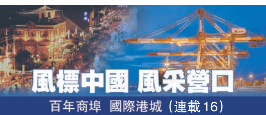
風標中國 風采營口 百年商埠 國際港城 (連載16)

低。以香港750萬人口為比較基準，奧地利現時疫情已相當於香港每天都有40人喪命，而事實上香港整個疫情的死亡人數為213人，即當地一星期的死亡人數已相當於過去近兩年的總數。歐洲疫情一旦肆虐下去，死亡數字難免繼續上揚，加上新變種病毒Omicron的出現，相關地方近日大幅收緊防疫要求以至封城封關，同時進一步推動疫苗普及甚至強制打針，相信有利疫情緩和，保障更多民眾的生命安全。