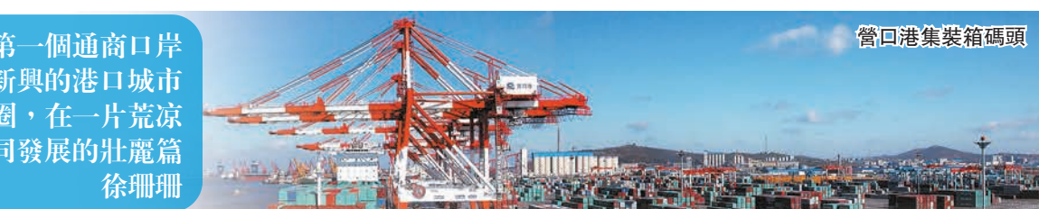
營口港集裝箱碼頭

一百多年前，遼寧營口成為東北地區第一個通商口岸對外開放；一百多年後，渤海岸邊一座新興的港口城市正悄然崛起。30多年間，營口港與鮫魚圈，在一片荒涼寂寥上，寫下了一座港口與一座新城協同發展的壯麗篇章。 徐珊珊