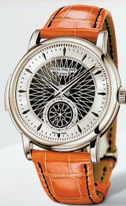
5750P 腕錶的橙色方形紋理鱷魚皮表帶，由人手縫製。