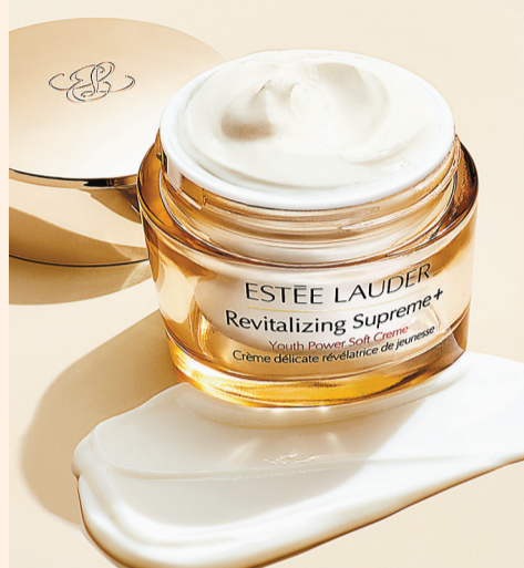
Estée Lauder 新生活膚彈活輕盈面霜，HK$960/ 75ml。

每逢轉季，肌膚會率先表現變化，護膚需求自然不同。通常冬日使用的滋潤型面霜和抗老保養品，在潮濕的季節下會感覺過於厚重。Estée Lauder近日推出膠原蛋白技術提升的 Revitalizing Supreme+ 新生活膚全能系列，其新生活膚彈活輕盈面霜質地感輕盈，當中增添的美蓉花-8分子精萃具高生物活性，令肌膚更緊致，獨有辣木精華別具修護肌膚效能。面霜可提拉蘋果肌、笑紋及下顎線條三大主要輪廓位置，淡褪皺紋、細紋及頸紋，令面部輪廓更立體分明。 文：儀