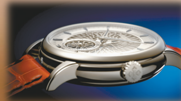
表殼直徑40毫米，厚度11.1毫米。