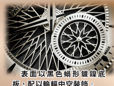
表面以黑色蝸形鍍銀底板，配以輪輻中空裝飾。