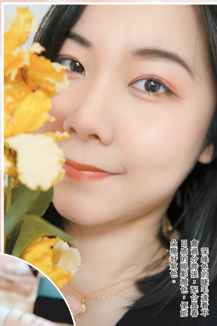
深綠色的睫毛膏看起來會過分誇張，配合具春日同感的眼影顏色，便能凸顯好氣息。

近年流行的彩色睫毛更適合春夏使用，相比經典的黑色、棕色睫毛膏更顯時尚。若擔心紅色、藍色等鮮明的睫毛膏難以駕馭，低調沉穩的墨綠色更適合化妝新手應用於日常妝容，當陽光照射時眼眸更具色彩感，散發獨特魅力。以下是筆者本季的妝品推介。 CH