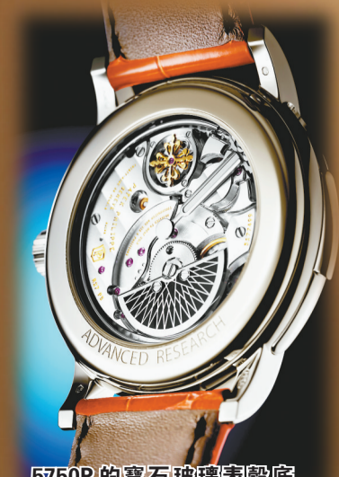
5750P的寶石玻璃表殼底蓋，複雜零件一目了然。