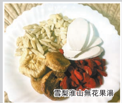
雪梨淮山無花果湯

食材：雪梨乾100克、南北杏20克、無花果乾4粒、麥冬40克、杞子20克、淮山6片、瘦肉約1斤、水3至4公升。