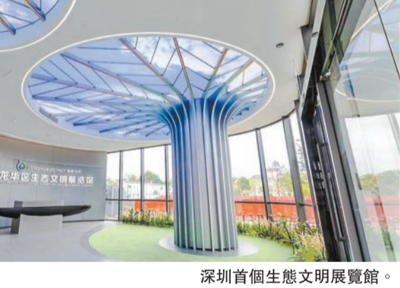
深圳首個生態文明展覽館。

【香港商報訊】記者常亮報道：深圳龍華區生態文明展覽館近日開館。該展覽館室內展廳面積1500㎡，室外園林面積約3000㎡，設計以「生態文明，時代藍圖」為開篇，布局美麗龍華、奮鬥龍華、綠色龍華和數字龍華4個篇章，講述生態資源、守護綠水青山、引領綠色發展、打造宜居空間的奮鬥紀實。 據了解，「十三五」期間，龍華區大力推進生態文明建設，揚生態之長，興綠色產業，謀民生幸福，成功創建國家生態文明建設示範區。