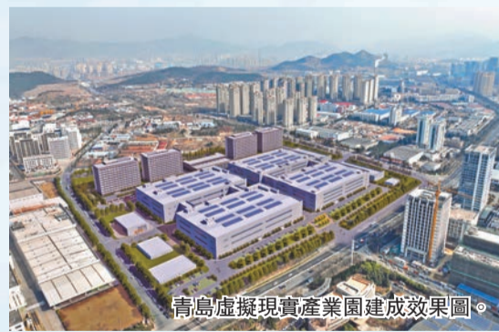
青島虛擬現實產業園建成效果圖。