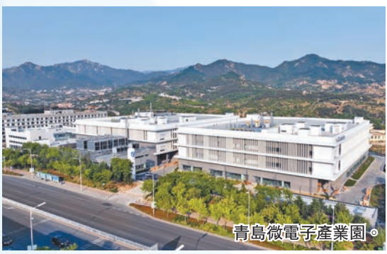
青島微電子產業園。

為夯實實體經濟根基，嶗山區實施「匯智嶗山」十大人才工程，獎勵高層次人才、優秀企業家超過5166萬元。率先發布《嶗山區加快實體經濟振興發展、建設「四新」經濟集聚區三年行動方案》，圍繞先進製造業、科技創新、樓宇經濟和高端中介服務等