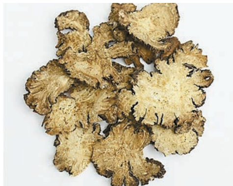
川芎具有祛瘀、祛風止痛、行氣活血作用。

這裏來說一說有關川芎的一則故事。相傳唐代初年，藥王孫思邈偕徒弟去終南山雲遊，到了四川青城山，師徒感果，在青松林