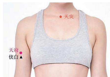
天突穴位於頸前正中線上，鎖骨正中凹陷處。天府穴位於腋紋下3寸，上臂二頭肌外側。俠白穴位於天府穴下1寸。

李醫師表示日常可以多按壓三個穴位，分別為天突穴、天府穴及俠白穴，有助護養肺部。他指出：「按壓天突穴有平喘、利氣之效，用於治療咽喉炎、支氣管炎、百日咳、聲帶疾病，平日按摩保養也能舒緩咳嗽、平喘化痰。天突穴可於咳嗽時按，按至微微痠痛，按壓時先閉氣10秒，再吸氣，反覆1至2分鐘。天突穴的位置皮膚較薄，容易獲得效果，但穴位下方正