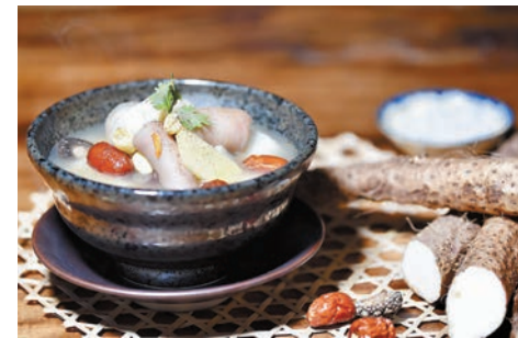
多吃山藥能補肺氣、改善虛勞與咳嗽。

養肺的重點是滋陰潤燥，以潤肺為主，李醫師解釋：「一般人可以多服用補肺氣的藥材煲湯飲用，如黨參、北芪、南北杏，又或藥效較強的鱸魚肉，而雪耳、沙參、麥冬、雪梨、玉竹、海底椰則着重潤燥補肺。」除了煲湯外，李醫師建議有五款食材可以多吃：「乳鴿性平味鹹，補肺益腎，益氣養血，屬陰陽兩補之食物；山藥性平味甘，同時能補脾養胃、補肺生津、補腎澀精；川貝苦甘微寒，功效清化熱痰，潤肺止咳，散結消腫；鱈魚（白鱈）性平味甘，補益肺氣，陰陽兩補，亦有健脾功能，《本草綱目》指可使人強壯有力；百合味甘，性微寒，能養陰潤肺止咳，清心安神。以上五款日常生活中容易買到的食物，無論是作為煲湯材料抑或單個煮來吃，對肺臟都有不同益處，一般人均適合食用，吃適量辛辣的食物，也有助