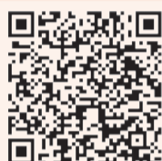
就職賀禮捐款呼籲